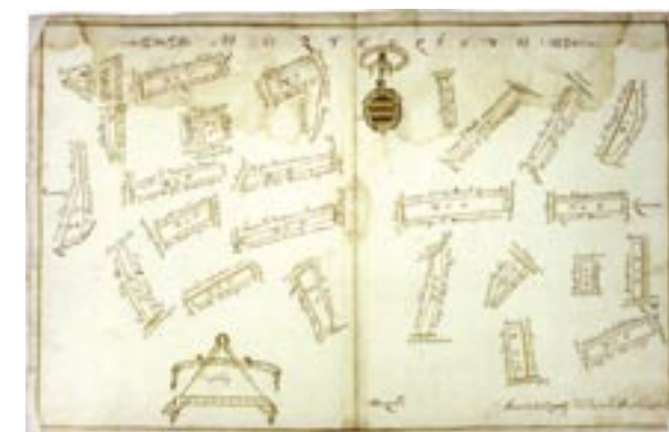
La tipica struttura agraria del Friuli, il maso, in una mappa degli Strassoldo relativa a Mortegliano.