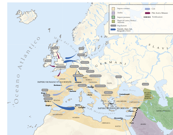
Una carta nel Piccolo Atlante del Medioevo, 249-1440.