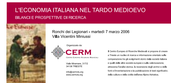
Il dépliant del primo convegno del CERM.

Anche nella promozione dei convegni l'iniziativa del CERM vedrà sia la dimensione regionale che quella italiana ed europea. Dopo la giornata dedicata all' Economia italiana nel tardo medioevo (Ronchi dei Legionari, 7 marzo 2006), sono allo studio convegni sulle Origini medievali dell'economia europea, sul tema Ostaggi, prigionieri, riscatti nel Medioevo , su Consenso ed opposizione alla dominazione veneziana nel Friuli e nell'Istria fra Tre e Quattrocento , su Agricoltura, produzione e commercio del vino nel Friuli medievale .